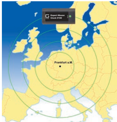
Abb. 2: Ausbreitung des DCF77-Signals

Nach erfolgreicher Installation der Hardware und Software leuchtet die LED an der Expert Mouse Clock grün und blinkt regelmäßig im Sekundentakt kurz rot auf. Leuchtet die LED nicht, überprüfen Sie bitte den Anschluss des Gerätes. Unregelmäßiges Blinken deutet auf schlechten Empfang bzw. eine Störung von außen hin. Ursache dafür können zum Beispiel Monitore oder andere elektronische Geräte sein. Suchen Sie in solchen Fällen eine bessere Empfangsposition. Auch durch Drehen der Expert Mouse Clock kann der Empfang verbessert werden (vgl. Abb. 2). Wenn Sie eine gute Empfangsposition gefunden haben, fixieren Sie die Expert Mouse Clock . Nach zwei bis drei Minuten wird die PC-Uhr synchronisiert.